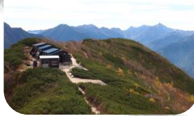
七倉登山口 から約6時間