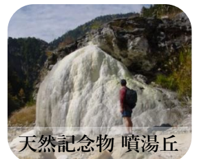
天然記念物 噴湯丘